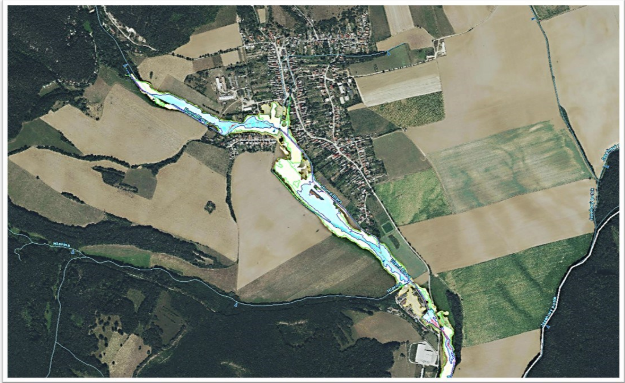
Mapa povodňového ohrozenia obce Dobrá Voda – čiastkové povodie Váh tok Horná Blava