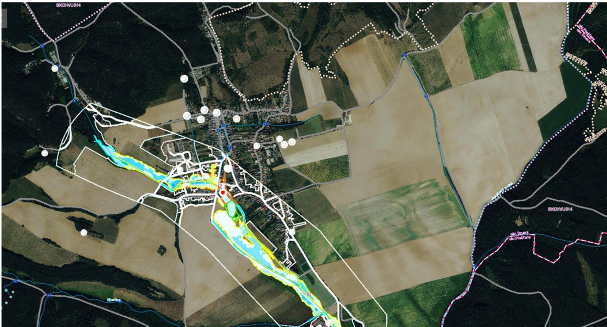
Mapa povodňového rizika obce Dobrá Voda – čiastkové povodie Váh tok Horná Blava